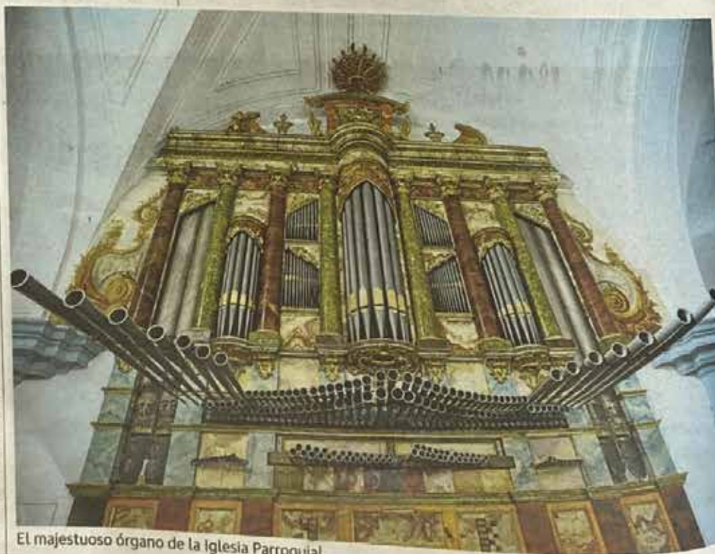
El majestuoso órgano de la Iglesia Parroquial.

milias ilustres diseminados por diversos caserones, algunos de ellos habitados, y una red subterránea de bodegas completan la melodía patrimonial de esta localidad poseedora de tradiciones ancestrales.