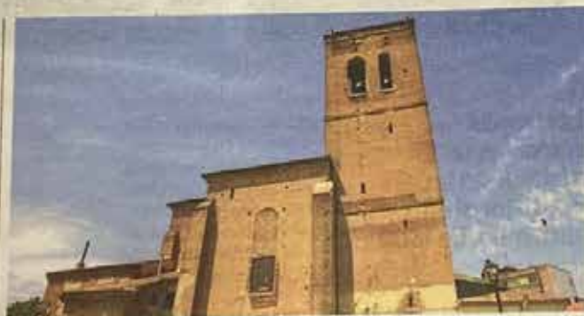
Iglesia de la Asunción.

E nclavada en el corazón de la Denominación de Origen Rueda (DO Rueda), La Seca, además de ser cuna de verdejo (es el municipio con mayor extensión de viñedo de toda la Comunidad), también es cuna de músicos, tal es así que puede presumir de poseer el órgano barroco más grande y completo de la provincia de Valladolid. Sus acordes han inundado de notas